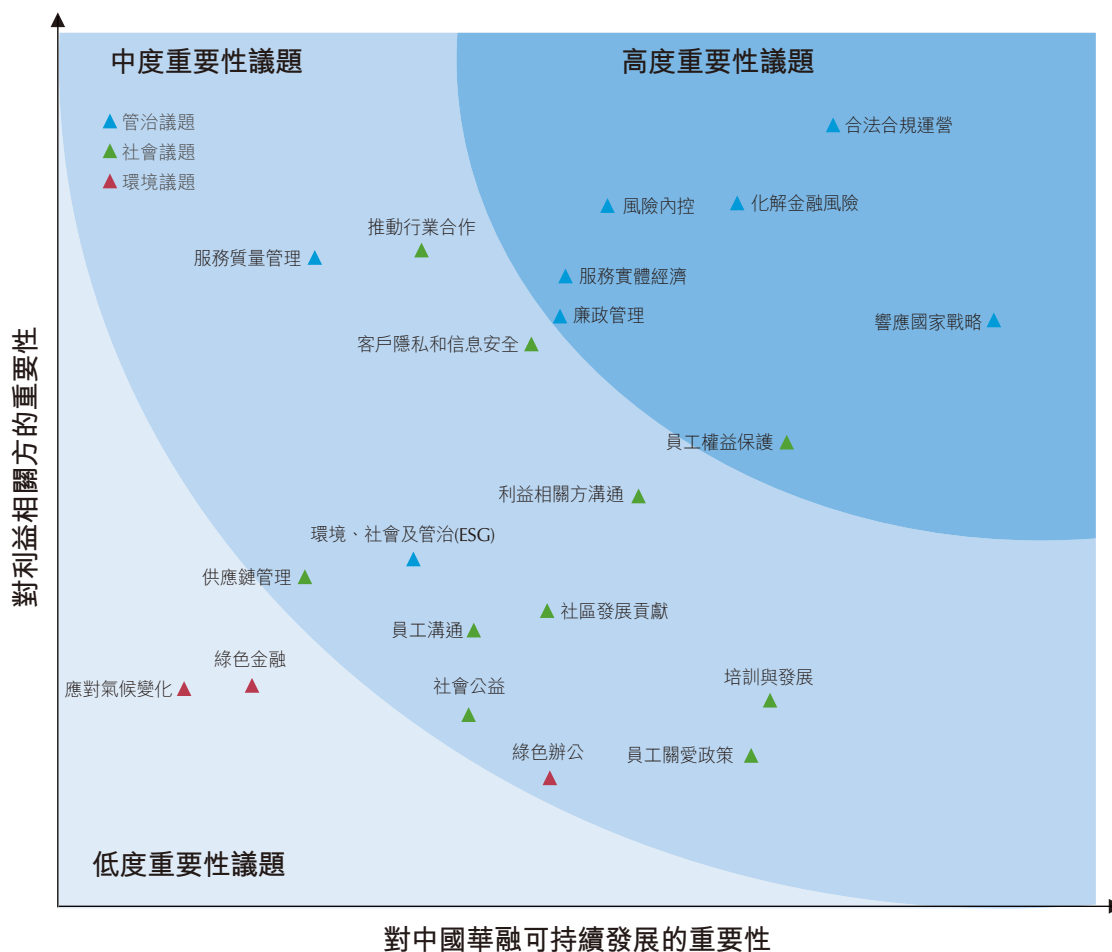
2022年社會責任重大性議題矩陣