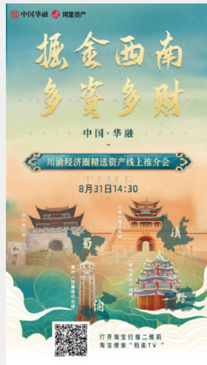
四川分公司舉辦華融西南片區 第二場精選資產推介會

公司充分發揮救助性金融服務的功能優勢，創新開展資產推介，幫助企業紓困。2022年8月，四川分公司牽頭舉辦了華融西南片區「掘金西南 多資多財」第二場精選資產線上推介會，重點推出位於成都、重慶、貴陽、昆明等地的21項精選資產，債權本金規模合計45.55億元；9月，四川分公司、重慶分公司連續2週在中國華融微信公眾號及自主研发的「融易淘」小程序上積極推介四川成都、樂山、南充及重慶債權資產，受到行業廣泛關注。